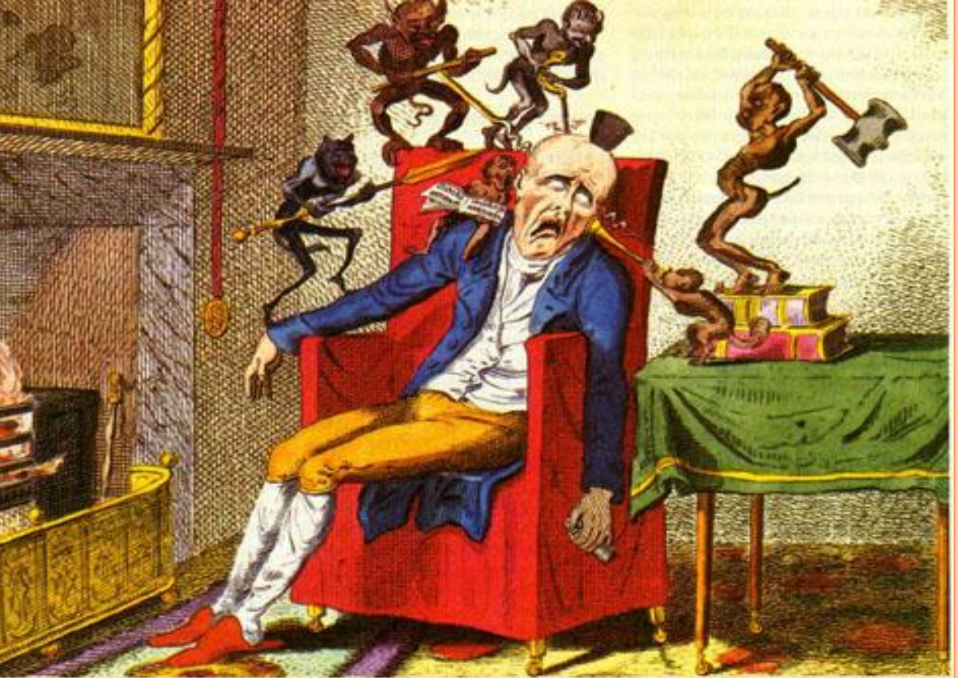
The Migraine as a Devil's act, 19th Century - France.